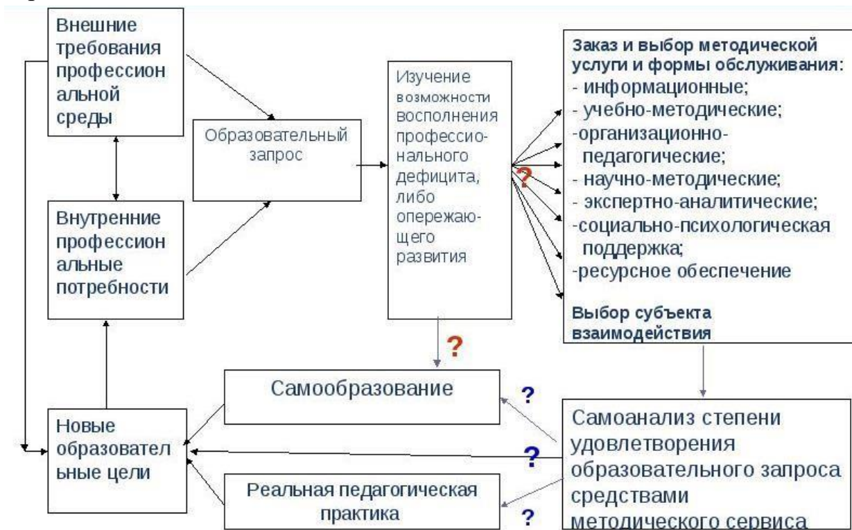
Рис.3 Алгоритм разработки ИОМ педагога

Предлагаемый алгоритм разработки ИОМ педагога (рис.3) учитывает как внешние требования профессиональной среды, так и внутренние профессиональные потребности, из которых формируется образовательный запрос самого педагога.